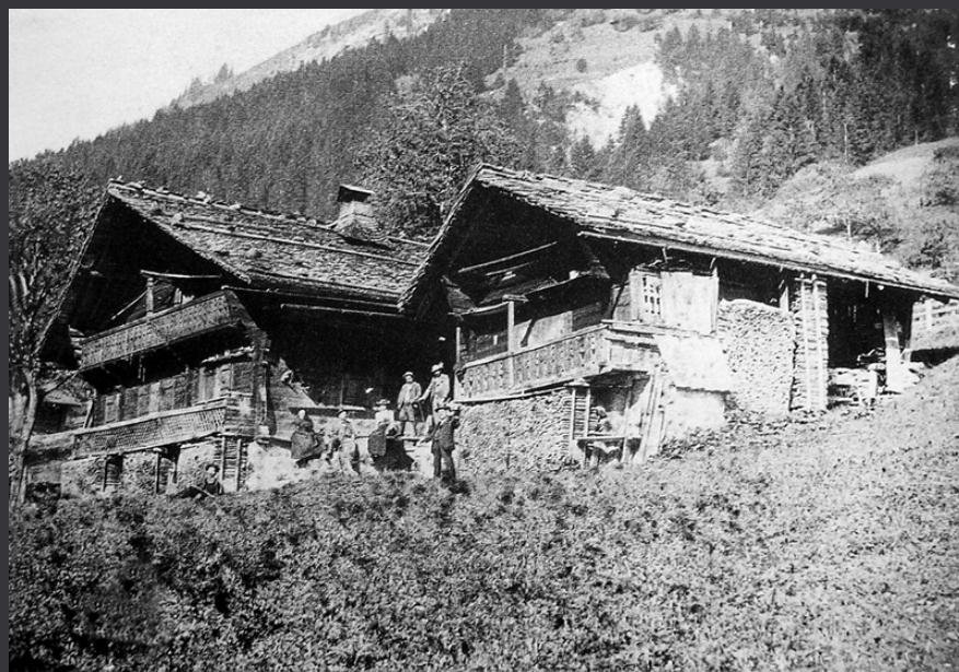
Chalet de la famille Berraz, Champéry – Suisse (1900).

À cela s'ajoute l'augmentation des taxes douanières avec les pays voisins. L'avenir est sombre. Les Carron, les Forclaz, les Rouyer, les Girard, les Cergneux et autres Dubois vendent leur maison pour trois fois rien et partent s'installer en Argentine.