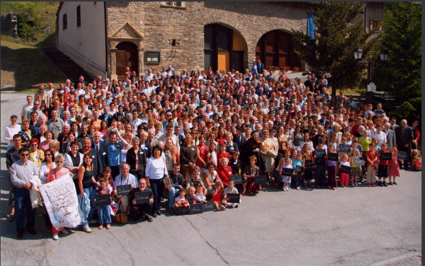
La « cousinade » du 15 juin 2005 regroupa plus de 450 personnes à Lanslebourg (vallée de la Maurienne, Savoie, France).

(1) Voir livres : Nos cousins d'Amérique d'Alexandre et Christophe Carron – Édition Monographic S.A. de Sierre – Suisse ( www.monographic.ch )