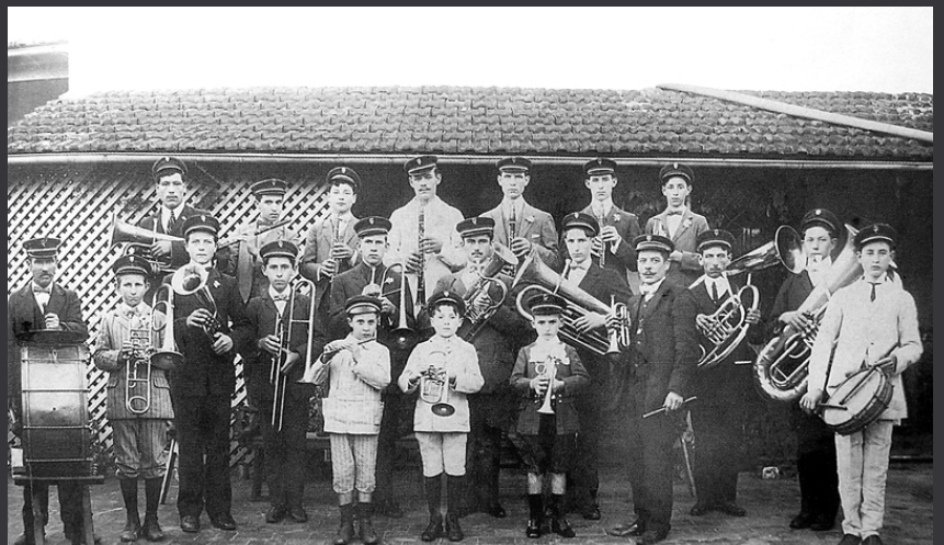
Harmonie municipale de San José (1910).