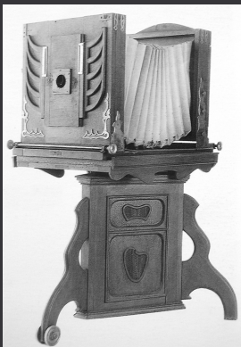
Appareil photo construit par José Maxit (1900) (Musée de l'Immigration, San José).