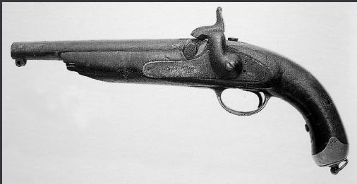
Pistolet de 1865. (Musée de l'Immigration, San José)