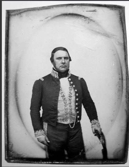
Le général Urquiza.