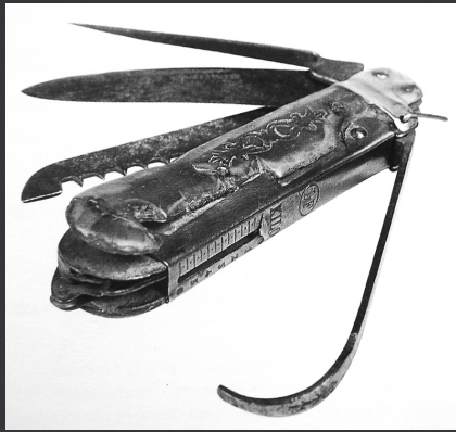
Couteau suisse avec balance.