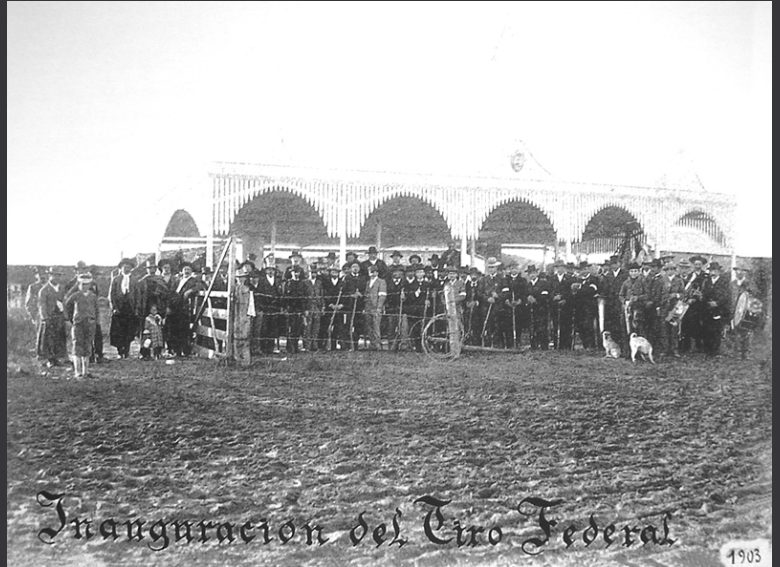
Inauguration du stand de tir fédéral – 1903.