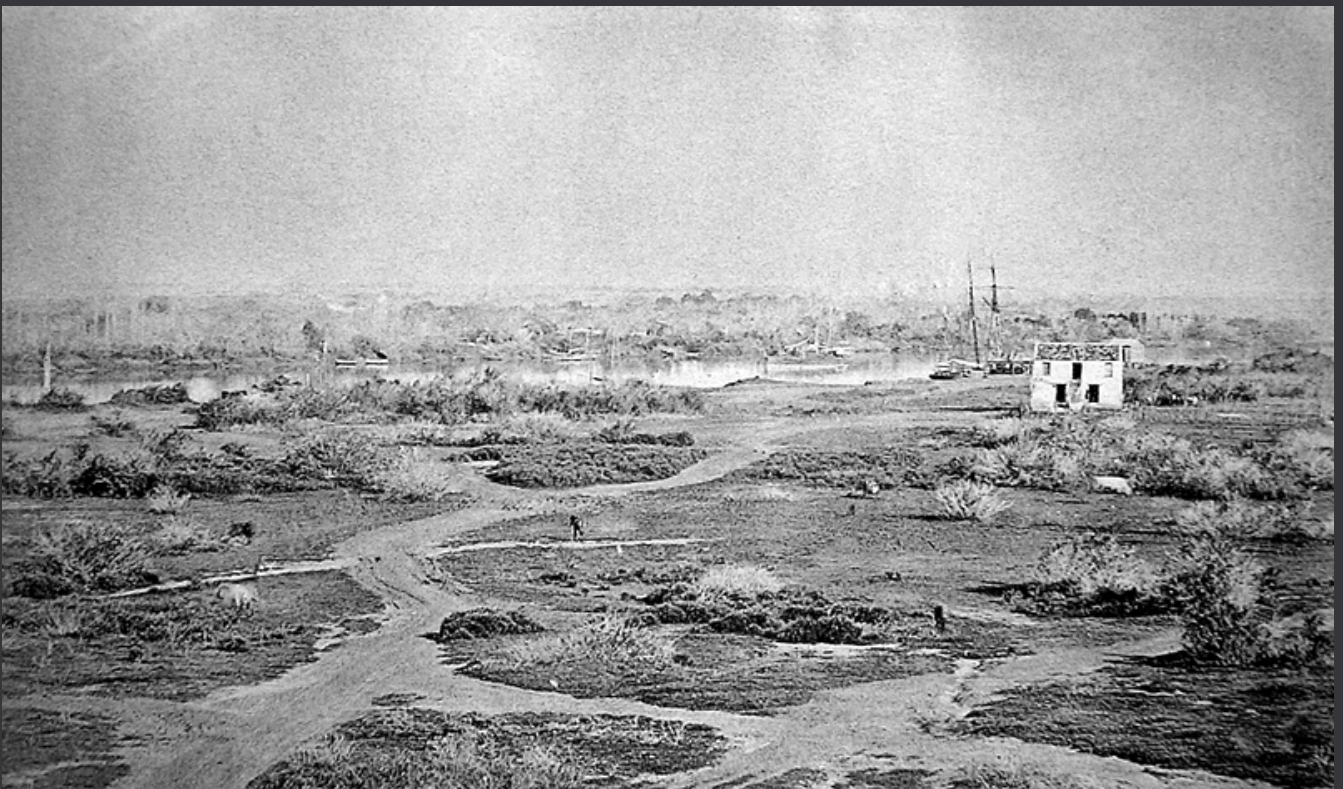
Vue du rio Uruguay en 1875, face à Concepcion del Uruguay (Argentine). Albumine de Saturno Massoni (Musée Delio Panizza).

Les premiers départs massifs ont lieu en 1850. Au port de Gênes (Italie), 244 pionniers embarquent sur le Corsa . Durant les trois mois du voyage, 36 passagers vont mourir du choléra. En quelques années, les Suiffet, les Davrieux, les Fodéré, les Mestrallet, les Albrieux, les Jorcin et beaucoup d'autres quittent la Savoie pour s'établir en Uruguay et en Argentine.